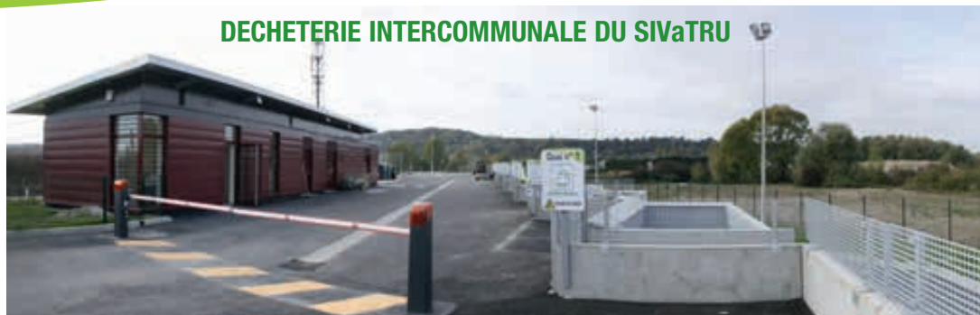
DECHETERIE INTERCOMMUNALE DU SIVaTRU

Inscription lors de la première visite sur présentation d'un justificatif de domicile de moins de 3 mois et d'une pièce d'identité en cours de validité.